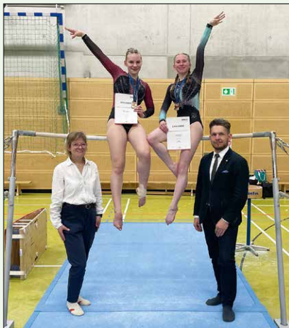
Sachsenmeisterschaft weiblich, Foto: Dirk Fischer

Fünf Mädchen starteten für den ATV Garnsdorf in den Pflichtklassen am 25. April in