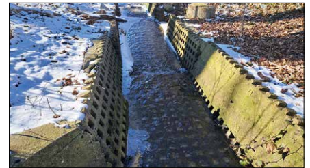
Ein mit Rasengittersteinen verbautes Gewässer. Die Platten sind instabil und im Hintergrund kann man sehen, wie sie bereits ins Gewässer fallen. Zurück bleibt ein ungeschütztes Ufer.

Wenn Rasengittersteine also aus dem Bach vor der Haustür oder in freier Landschaft entfernt