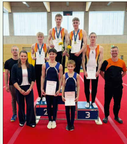
Sachsenmeisterschaft männlich

Bei den Bezirksmeisterschaften wurden einige Qualifikationen für die Sächsischen Landesmeisterschaften erturnt. Diese fanden am 9. Mai für den weiblichen und am 10. Mai für den männlichen Bereich statt.