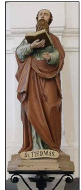
Thomas, der anfangs nur glauben wollte, was er sieht, als Apostelfigur in der Kirche Niederlichtenau.

Da wächst ein Mensch in atheistischem Umfeld auf, hat keine Antenne und kein Interesse für Gott – aber dann passieren Dinge in seinem Leben und er macht Erfahrungen, die ihm keine Wahl mehr lassen, als die Realität Gottes anzuerkennen – und er beginnt ihn zu suchen. Da begegnet ein Mensch wirklichen Christen, die einen täglichen und natürlichen Kontakt zu Gott pflegen – und ist von ihrer Lebensfreude, ihrem Vertrauen in die Zukunft und ihrer echten Liebe so beeindruckt, dass er anfangs die Gemeinschaft dieser Menschen, später immer mehr die Gemeinschaft ihres Gottes sucht – und nie wieder missen möchte. Was wird ein Gottesleugner mit seiner Argumentation bei solchen Menschen erreichen? Er wird sich ihr aufrichtiges Mitleid erwerben!